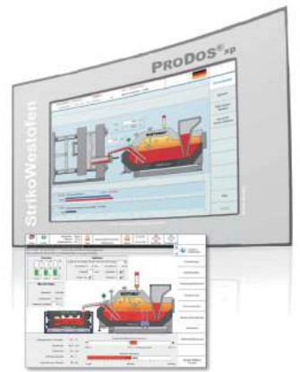
上图: WESTOMAT® ProDos®xp 下图: 带15寸触摸屏的 WESTOMAT® VPC 动态操作界面

为设备操作人员提供诊断工具 我们专门为 WESTOMAT® 定量炉开发了实用的诊断工具。控制数据可以轻易的通过U盘导入到软件中，我们的客户可以从互联网上免费下载。只需几秒钟，就可对最重要的系统参数进行分析并且显示其中任何潜在的偏差。