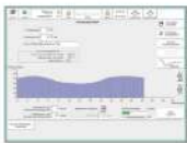
用户界面模块储存

在重力浇注时浇注程序由模块存储管理。在一个标准的应用程序中，能按需求储存可由浇注机直接调用 80 条程序。它可以要求扩展到存储 10000 条浇注程序。此外，数据库里还可以按字母数字顺序存储另外 10000 条程序。每个存储空间可以用作存储一条常用的 5 步浇注程序或一条动态浇注程序。还可以以常用程序转换为动态程序，反之亦然。在这个过程中不会丢失数据。为了数据安全不丢失，在每个控制中集成了一个数据备份功能。把所有输入的数据自动保存到可插入的存储卡上。